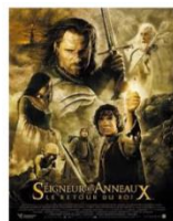
Le seigneur des anneaux, Peter Jackson