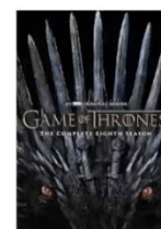
Game of thrones, HBO