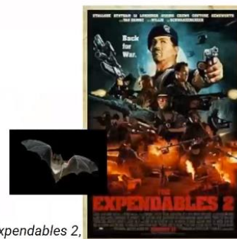
Expendables 2 , Simon West

Indirectement, les différents films tournés en Nouvelle-Zélande ont aussi participé à rendre populaire le pays dans le monde et attiré des touristes dans la région. 1/5 des touristes disent vouloir s'y rendre depuis qu'ils ont vu le seigneur des anneaux.