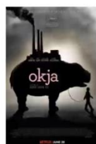
Okja, Bong Joon-Ho