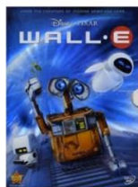
WALL-E, Andrew Stanton