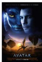
Avatar, James Cameron