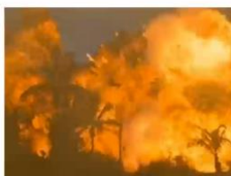
Apocalypse Now , Francis Ford Coppola

Enfin, les tournages ont souvent un impact négatif sur l'environnement du tournage en lui-même. Par exemple, dans Apocalypse Now , les scènes de forêt qui partent en fumée ne sont pas des images de synthèses : ils ont réellement eu l'autorisation de détruire des parcelles de forêt, et tout ce qui y vivait. De la même manière, la faune du désert dans Mad Max est détruite par un camion et plus de la moitié d'une population de chauves-souris décimée par le tournage de Expendable 2 dans la grotte où elles vivaient.